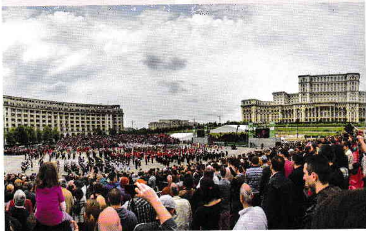
Jos: Paradă în imensa Piață a Constituției, dominată de gigantul Palat al Parlamentului

Fostul Palat Regal al României, un edificiu neoclasic de proporții care domină Piața Revoluției, adăpostește astăzi cele mai valoroase piese din colecțiile de artă ale