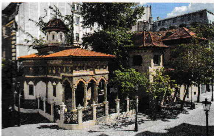
IMAG: Mănăstirea Stavropoleos (1724)

În acest muzeu original, care trece dincolo de suprafața obiectelor, reușind să le scoată la iveală semnificațiile adânci, fiecare exponat prinde viață și-și spune povestea în cadrul unui traseu inițiativ presărat cu semne. După această explorare inedită a universului spiritual rural român, relaxați-vă în animatul Club al Țăranului și admirați produsele meșteșugărești expuse în cadrul târgului găzduit în aproape fiecare weekend de curtea interioară.